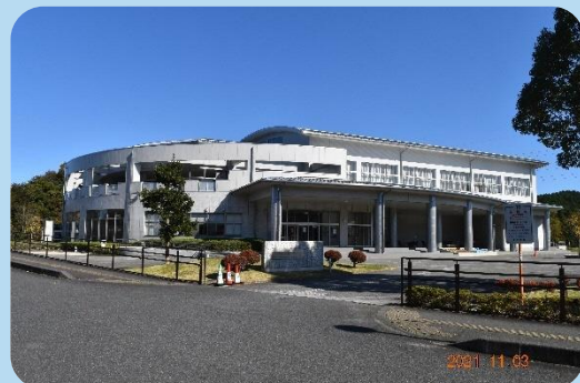
南部アリーナ外観