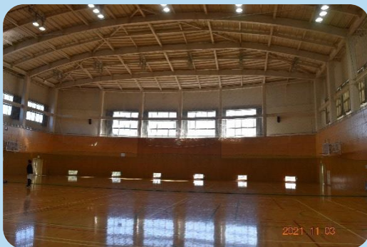
南部アリーナ内観